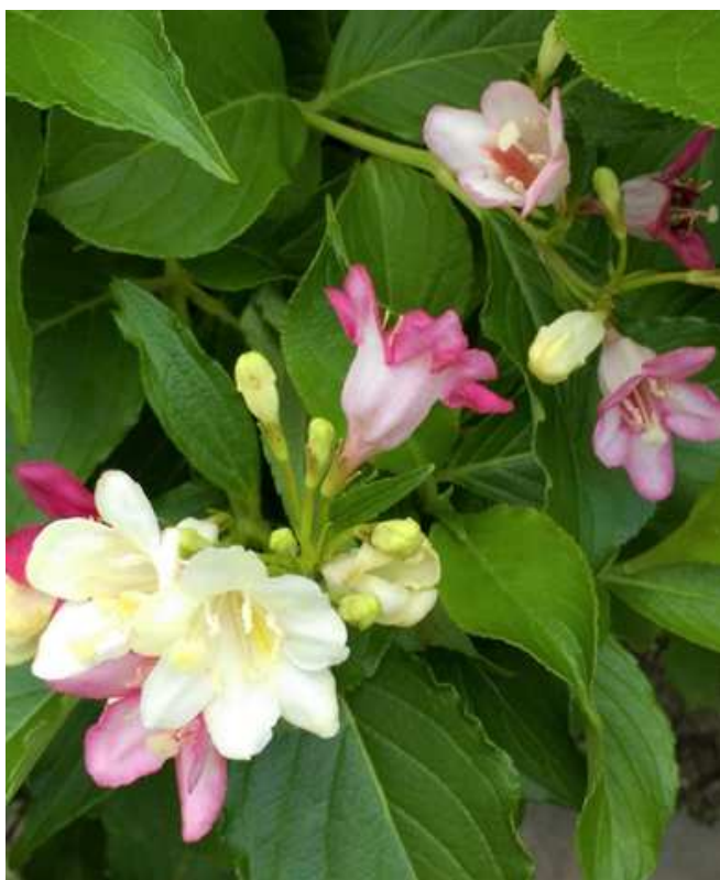
撮影地 大阪府豊中市 「春さがし」