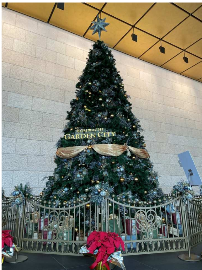
撮影地 大阪府大阪市本町 「クリスマスツリー」