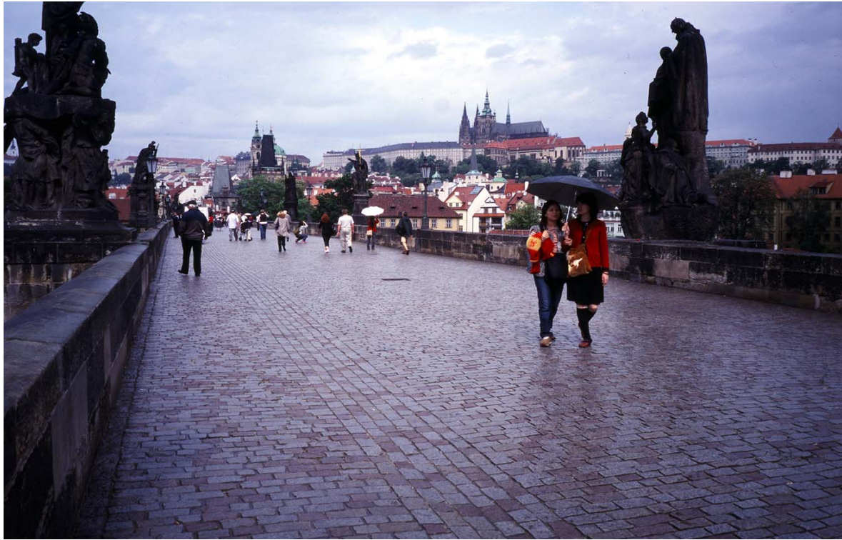
撮影地 チェコプラハ「雨上がりのカレル橋」