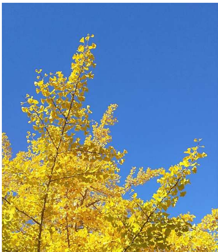
撮影地 大阪府豊中市 「黄葉の秋空」